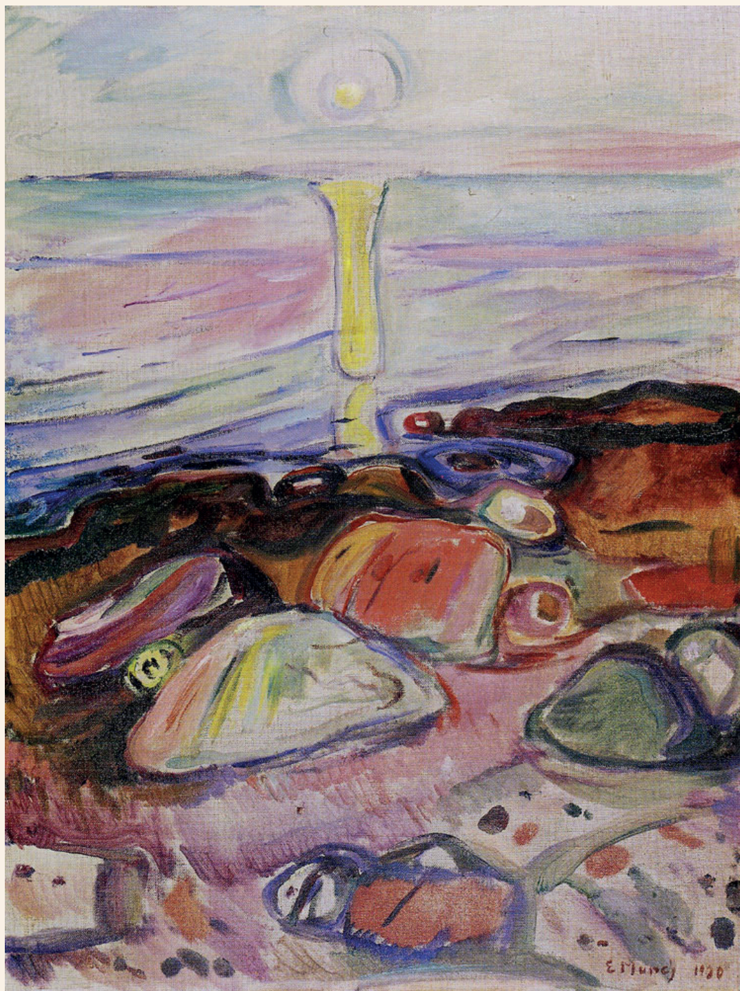
Edvard Munch: Moonlight on the Fjord, 1920